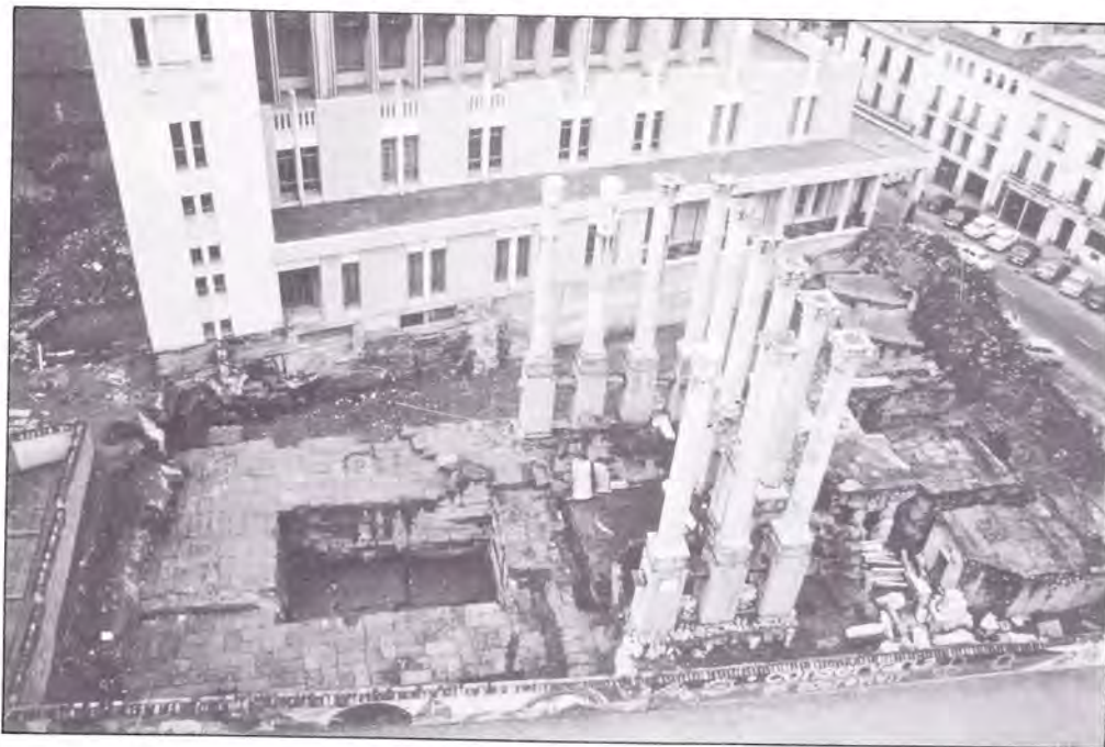
LÁMINA I. Aspecto general del templo romano de la calle Claudio Marcelo en Córdoba, visto desde el Sur.

En líneas generales, los trabajos de estos investigadores afectaron, en esencia, al sistema de gruesos contrafuertes dispuestos a modo de abanico con la finalidad de contener los rellenos sobre los que asentaba la cimentación del templo, así como al altar dispuesto delante de la escalera del templo y a la pronaos del edificio religioso (Lám. II). En ausencia de García y Bellido, se practicaron dos galerías, una que pasaba por debajo del pabellón nuevo del Ayuntamiento y la otra galería más baja, paralela a la anterior, que iba en busca del extremo occidental de los cimientos del templo con objeto de conocer la longitud total del edificio. En cambio, no llegó a descubrirse la cella ni el posticum , ya que ambos elementos debían encontrarse debajo del edificio de los Servicios Técnicos Municipales, extremo que ha quedado confirmado tras nuestras investigaciones más recientes.